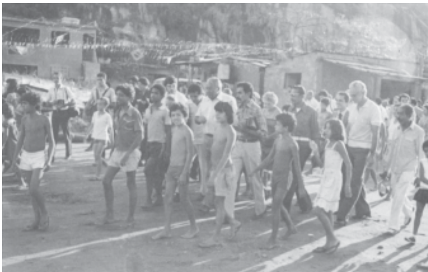
Ministro Andreazza visita a favela da Maré. Rio de Janeiro, 25 de junho de 1982.