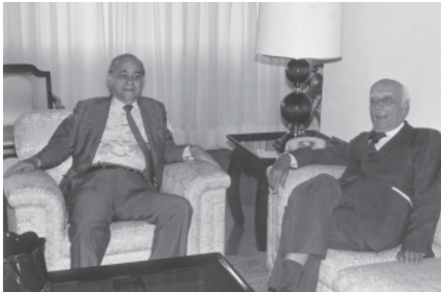
Tancredo Neves com o deputado Ulisses Guimarães. S.I., 8 de fevereiro de 1985.

mandato (1979-1982). Ingressou no PMDB e elegeu-se governador de Minas Gerais (1983-1984). Em virtude da derrota da emenda Dante de Oliveira, que propunha a realização de eleições diretas para presidente da República em 1984, foi lançado candidato à presidência por uma coligação de partidos de oposição reunidos na Aliança Democrática, tendo como vice o senador José Sarney. Foi eleito presidente da República pelo Colégio Eleitoral em 15 de janeiro de 1985, vencendo o candidato governista Paulo Maluf. Na véspera da posse, em 14 de março de 1985, foi internado em estado grave, assumindo interinamente o cargo o vice-presidente José Sarney. Faleceu em São Paulo, no dia 21 de abril de 1985. A lei nº 7.465, de 21 de abril de 1986, determinou, em seu art. 1º, que Tancredo Neves passaria a figurar na “galeria dos que foram ungidos pela Nação brasileira para a Suprema Magistratura, para todos os efeitos legais”.