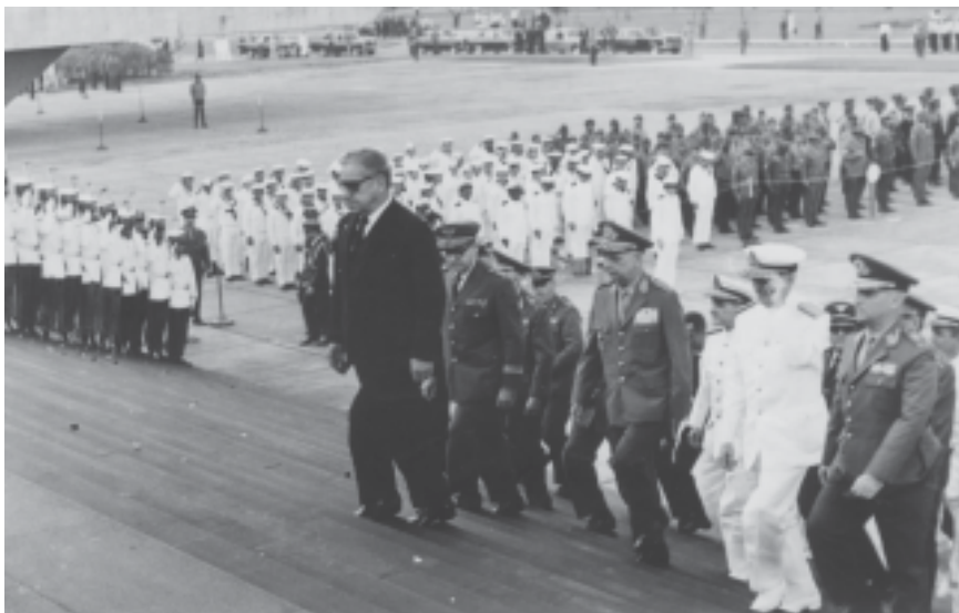
Costa e Silva em solenidade comemorativa do Dia da Vitória, no Monumento aos Mortos da Segunda Guerra Mundial. Rio de Janeiro, s.d. Arquivo Nacional.

sufocando o processo de reformas conhecido como “Primavera de Praga”. No Brasil, o Comando de Caça aos Comunistas (CCC) depredou o Teatro Ruth Escobar, em São Paulo, e agrediu o elenco da peça Roda viva ; foi lançada a revista Veja e um novo filme de Glauber Rocha, O dragão da maldade contra o santo guerreiro . Em 1969, Yasser Arafat tornou-se o líder da OLP; o presidente De Gaulle renunciou na França, sendo substituído por Georges Pompidou; o presidente Nixon iniciou a retirada dos soldados americanos do Vietnam; o Festival de Woodstock reuniu cerca de 500 mil jovens; Neil Armstrong, astronauta americano da Apollo XI , pisou pela primeira vez na Lua; católicos e protestantes entram em choque na Irlanda do Norte; fracassou a tentativa de golpe no Chile; e, na Líbia, o coronel Khadafi derrubou a monarquia. No Brasil, o capitão do Exército Carlos Lamarca desertava para integrar a organização de esquerda Vanguarda Popular Revolucionária (VPR), foi lançado o semanário O Pasquim e o musical Hair estreava.