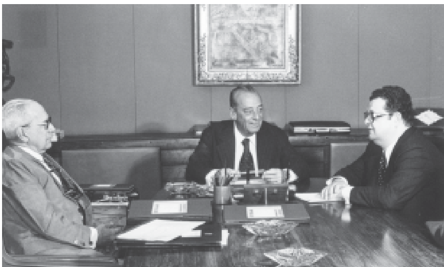
Audiência do presidente Figueiredo com os ministros Golberi do Couto e Silva e Delfim Neto. Brasília, 14 de agosto de 1979.