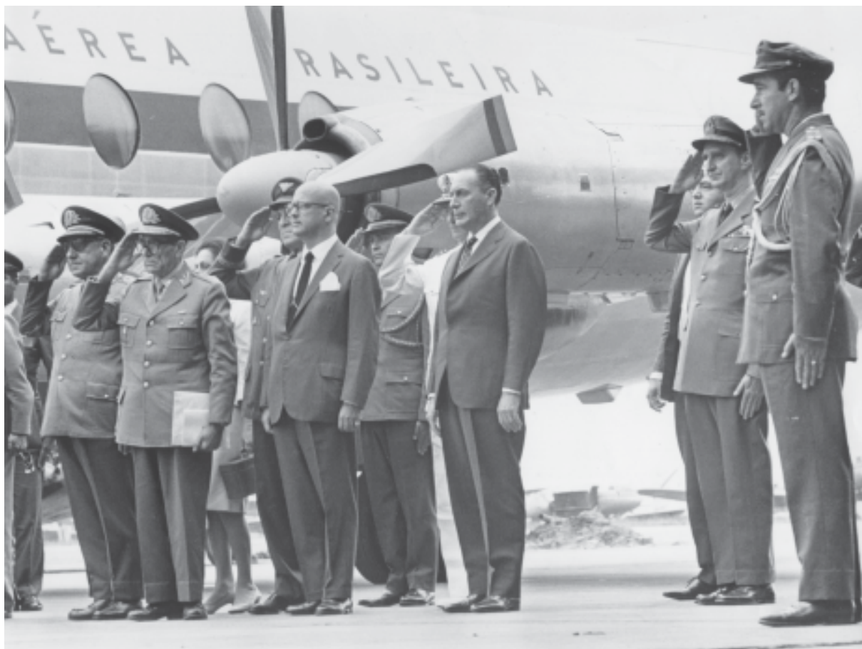
Ao centro, o presidente Mazzilli. Brasília, 4 de abril de 1964.