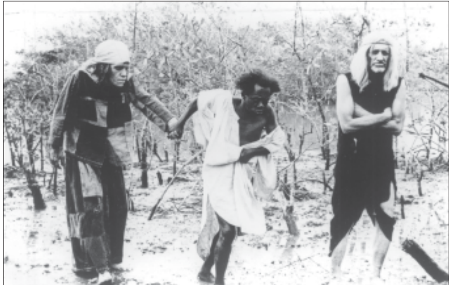
Cena do filme Macunaíma, de Joaquim Pedro de Andrade, 1971.

Richard Nixon visitou a China, cujas relações diplomáticas com os EUA estavam rompidas desde 1949. Ainda em 1972, o mundo ficou abalado com dois graves acontecimentos: o uso de bombas de napalm contra os vietcongs e a ação terrorista da organização Setembro Negro contra a delegação israelense nas Olimpíadas de Munique. No Brasil, era lançado mais um semanário de oposição, o Opinião , estreava a primeira novela em cores, O bem amado , de Dias Gomes, na TV Globo; e morria a atriz Leila Diniz, em acidente de aviação. Em 1973, encerrou-se oficialmente a guerra do Vietnã, mas o cessar-fogo não foi obedecido; o presidente chileno Salvador Allende foi morto durante golpe militar; a Argentina elegeu Perón e Isabelita, sua esposa, presidente e vice-presidente da República; árabes e israelenses iniciaram a guerra do Yom Kippur; na Grécia, Papadopoulos proclamou a República mas foi derrubado por golpe militar. No Brasil, ocorreu o I Festival de Cinema de Gramado; Gianfrancesco Guarnieri escreveu Um grito parado no ar e Leon Hirzman adaptou para o cinema São Bernardo , de Graciliano Ramos. Em janeiro de 1974, teve início no país a censura prévia de rádio e televisão.