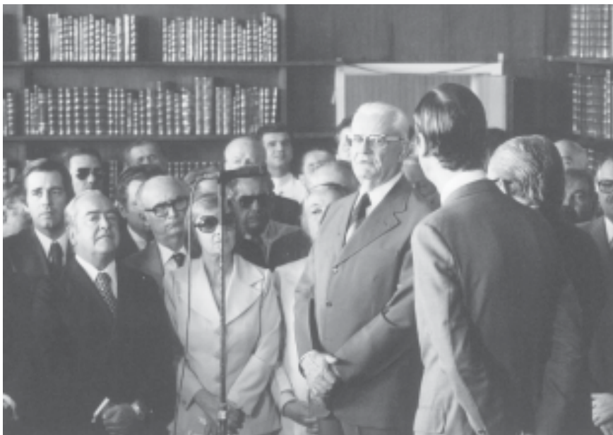
Encontro do presidente Geisel com membros da Arena no Palácio da Alvorada. Brasília, 14 de outubro de 1978.