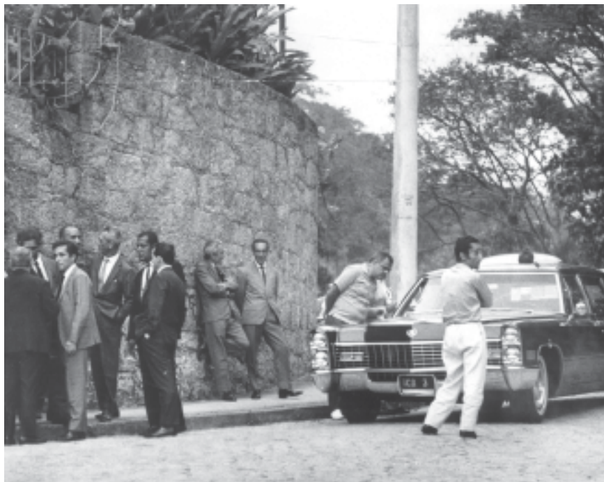
Rua Euclides Figueiredo, em Botafogo, onde foi encontrado o carro do embaixador americano Charles Elbrick, seqüestrado por militantes das organizações clandestinas ALN e MR-8. Rio de Janeiro, 5 de setembro de 1969.

Aurélio de Lira Tavares, general. Militar, nascido na cidade de Paraíba, atual João Pessoa, no estado da Paraíba, em 7 de novembro de 1905. Serviu no Estado-Maior do Exército (1943), tendo sido encarregado de organizar a Força Expedicionária Brasileira (FEB). Durante o governo Castelo Branco foi comandante do IV Exército; em 1966, passou a comandar a Escola Superior de Guerra (ESG) e, durante o governo Costa e Silva, assumiu o Ministério do Exército (1967-1969). Em abril de 1970 foi eleito membro da Academia Brasileira de Letras e, em junho, foi nomeado embaixador do Brasil na França, cargo que ocupou até dezembro de 1974. Faleceu em 18 de novembro de 1998.