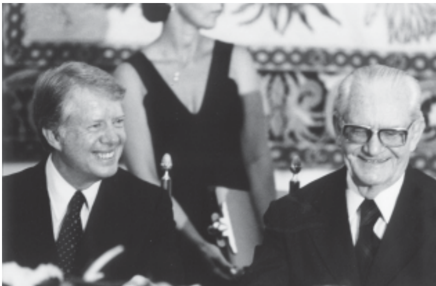
Recepção oferecida ao presidente americano Jimmy Carter no Palácio da Alvorada. Brasília, 28 de março de 1978.