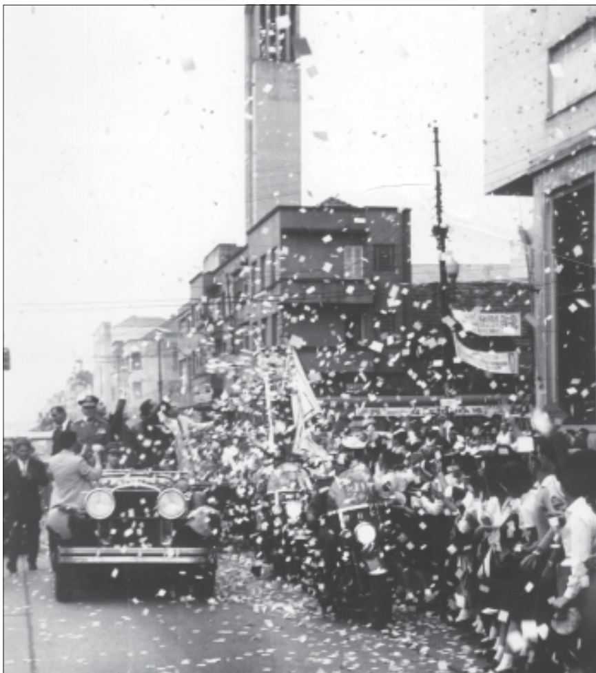
O presidente João Goulart no Rio Grande do Sul, novembro de 1961.

Acre foi elevado à condição de estado. Em 1963, uma multidão assistiu ao assassinato do presidente norte-americano John Kennedy, em Dallas, Estados Unidos. Ainda em 1963, chegou às telas o filme Vidas secas , de Nelson Pereira dos Santos, baseado no romance homônimo de Graciliano Ramos, e Paulo Freire desenvolveu no Nordeste o método de alfabetização em massa que o notabilizou como educador.