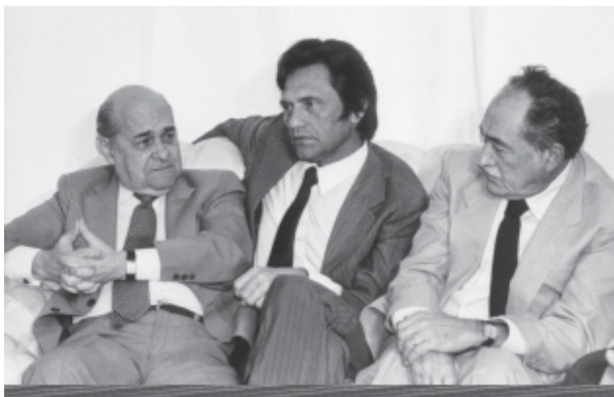
Tancredo Neves com Marcos Freire e Miguel Arraes, ambos do PMDB de Pernambuco. S.I., 11 de janeiro de 1985.