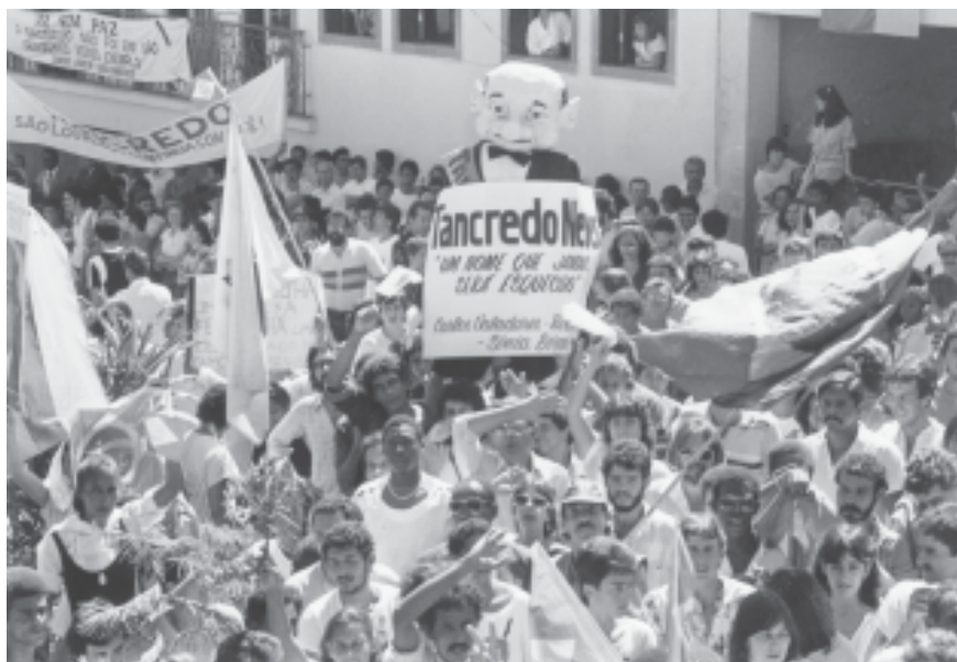
Funerais do presidente Tancredo Neves chegam em São João del Rei. Minas Gerais, 24 de abril de 1985.